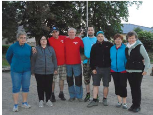
PLP proti Kolínu