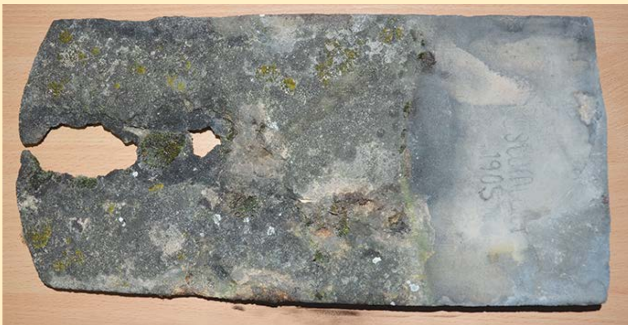
Střešní taška vyroběná v místní cihelně