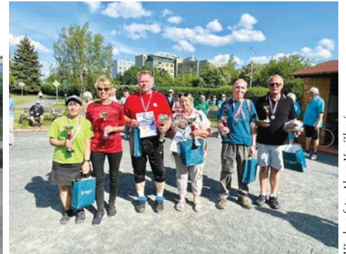
Pražské jaro, 6. ročník /již po čtvrté jsme ho vyhráli/