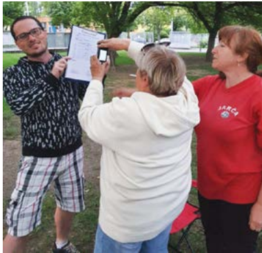
Tak fotím výsledky na PLP